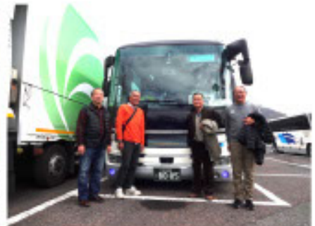
途中のサービスエリア