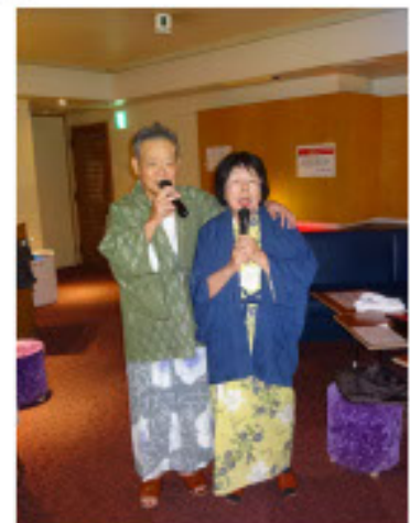
青春の思い出に 心を弾ませて!