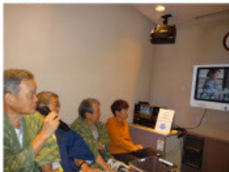
俺の十八番は入れたぞ!