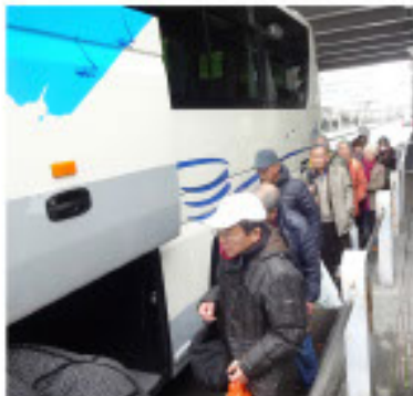
埼玉新都心で乗車 車中で酒を飲む人は居なかったーマナー良し!