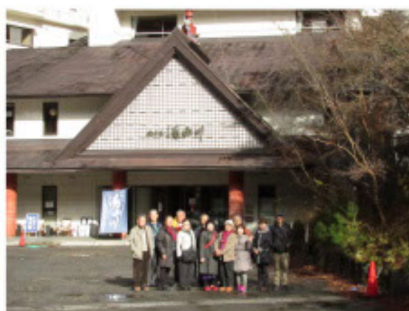
伊藤園湯西川温泉ホテル