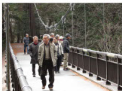
帰りはホテルまで、歩いて帰る