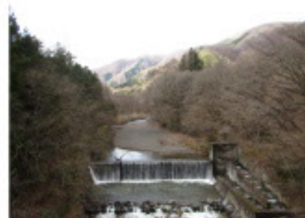
吊り橋の下を流れる清流