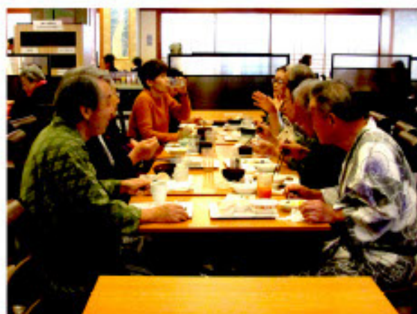
朝食は、昨夜のカラオケの話で持ちつきり