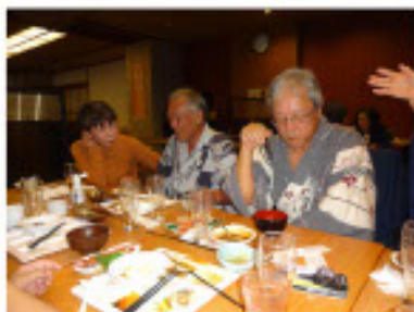
夕食は豪華なバイキング