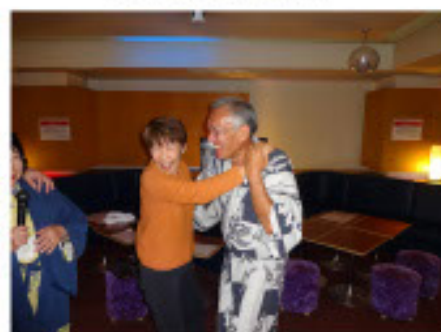
熱演、タンゴ 昔は、相当やったんだろうね