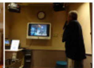
「好きよ イスタンブール」 を歌って居るのは 誰だ? 真ん中の人 誰?