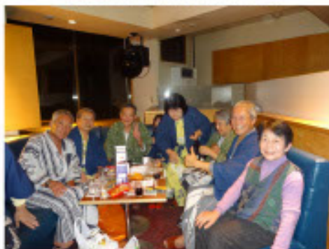
右端の女性連れてきたりして!